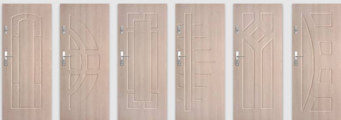
ENTER/SOLID 12 ENTER/SOLID 13 ENTER/SOLID 14 ENTER/SOLID 15 ENTER/SOLID 16 ENTER/SOLID 17