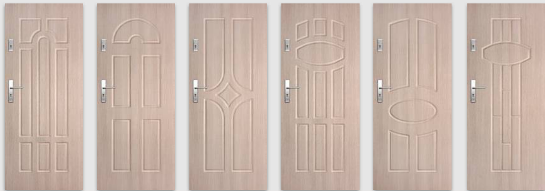
ENTER/SOLID 6 ENTER/SOLID 7 ENTER/SOLID 8 ENTER/SOLID 9 ENTER/SOLID 10 ENTER/SOLID 11