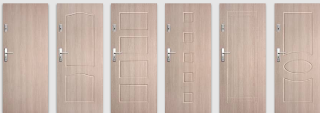
ENTER/SOLID 0 ENTER/SOLID 1 ENTER/SOLID 2 ENTER/SOLID 3 ENTER/SOLID 4 ENTER/SOLID 5

Dla modeli Enter/Solid 0 dostępny również laminat CPL 0,7-0,8 mm - w celu złożenia zamówienia prosimy o kontakt z Działem Obsługi Klienta.