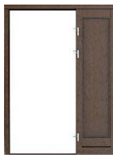
PRAWY PEŁNE do drzwi prawych