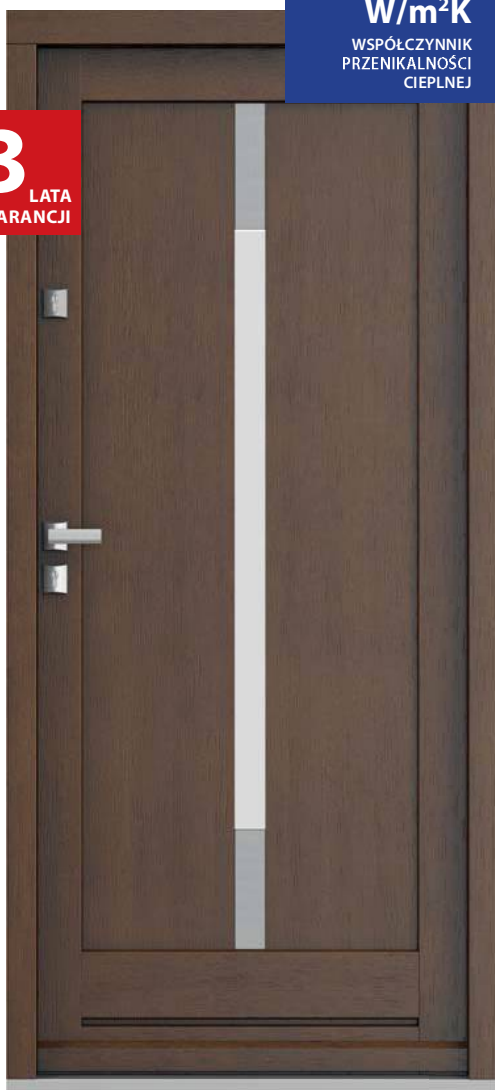
Eco NORD A.5, Dąb 1