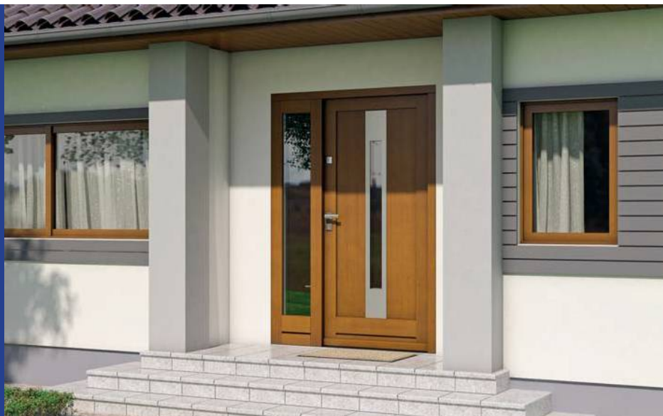
Eco NORD A.3, Dąb 5, naświetle prawe

Bądź Eco oszczędzaj energię i korzystaj z dopłat