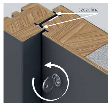
PO zamknięciu ~ 3 mm

Zmniejszenie szczeliny po zamknięciu zamka zwiększa izolacyjność termiczną skrzydła.