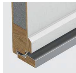
Ciepły próg Porta ThermControl**