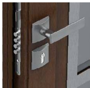
Dwa zamki wielopunktowe Antywłamaniowe klasy 4