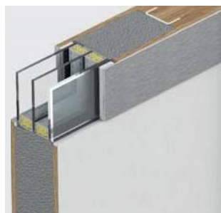
Dwukomorowe przeszklenie antywłamaniowe klasy P4 i ramka ze stali nierdzewnej

Ramka ze stali nierdzewnej z jednej strony (zewnętrznej).