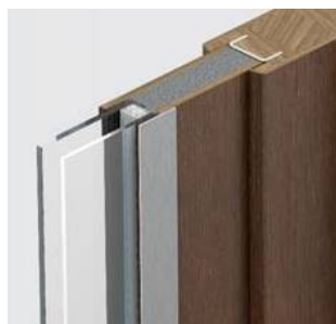
Jednokomorowe przeszklecie antywłamaniowe klasy P4 i ramka ze stali nierdzewnej

Ramka ze stali nierdzewnej z jednej strony (zewnętrznej).