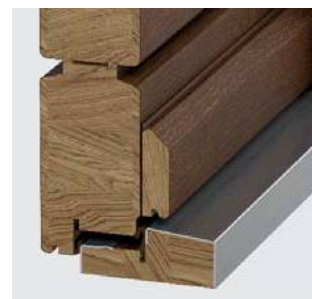
Ciepły próg Porta ThermControl**