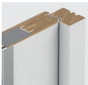
Wręg francuski od strony zawiasowej