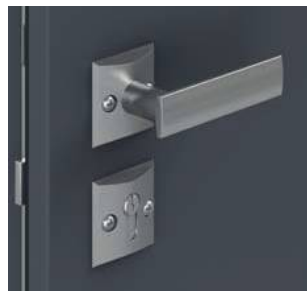
Klamka jednostronna i rozeta CORTES w kolorze srebrnym