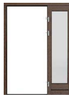
PRAWY do drzwi prawych

Stronę naświetla określamy patrząc od strony widoczności zawiasów.