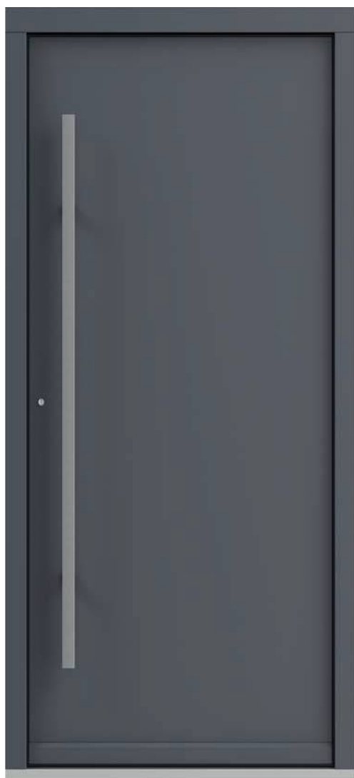
Eco POLAR PASSIVE, pełne, Antracyt

** dostępny tylko w kolekcjach Eco Polar i Eco Polar Passive