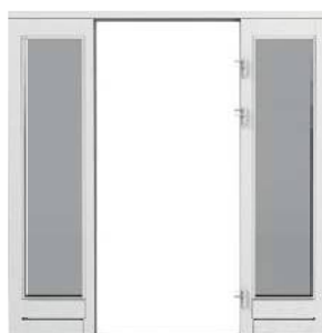
PODWÓJNE do drzwi prawych