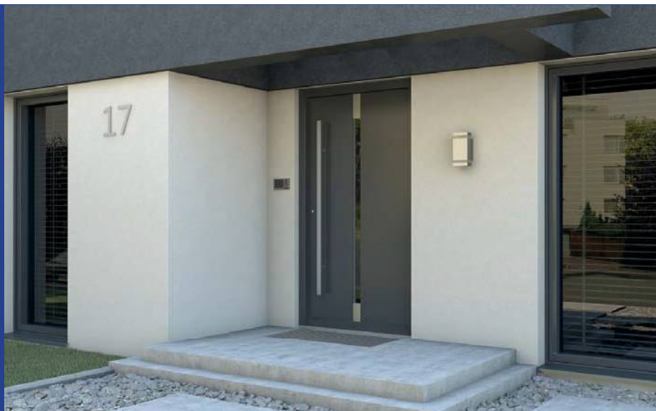
Eco POLAR PASSIVE A.5, Antracyt

Bądź Eco oszczędzaj energię i korzystaj z dopłat