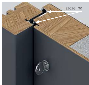
PRZED zamknięciem ~ 5 mm