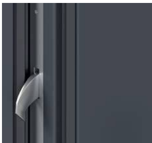
Zamek listwowy z mechanizmem dociskowym Winkhaus STV • wersja z kutymi hakami • regulacja zaczepu zamka