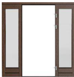
PODWÓJNE do drzwi prawych