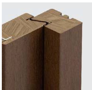
Wręg francuski od strony zawiasowej