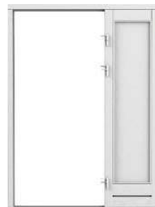
PRAWY PEŁNE do drzwi prawych