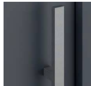
Pochwyt jednostronny prosty w kolorze srebrnym o dł. 1500 mm**