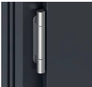
Zawias Premium Simonswerk serii 4000 regulacja 3D • nośność 160 kg • wzmocniony antywłamaniowo • gwarancja działania 30 lat (200 tys. cykli)