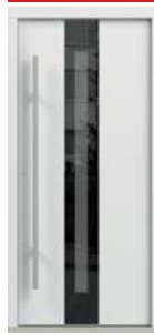
model C.3 panel szklany obustronny