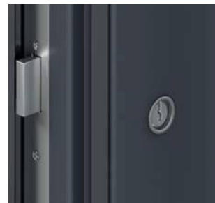
Mini rozeta (strona zewnętrzna)*