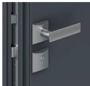
Klamka obustronna i rozeta CORTES w kolorze srebrnym