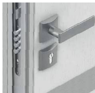
Dwa zamki wielopunktowe Antywłamaniowe klasy 4