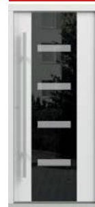
model C.4 panel szklany obustronny